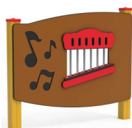
PANNELLO MUSICALE x1