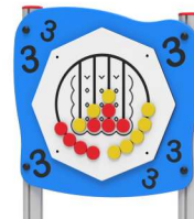
PANNELLO LUDICO x1