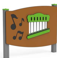
PANNELLO MUSICALE x1