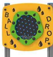
PANNELLO SENSORIALE x1