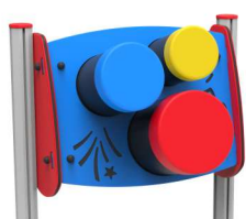
PANNELLO MUSICALE x1